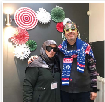
▼ 移民夫婦參加聖誕活動